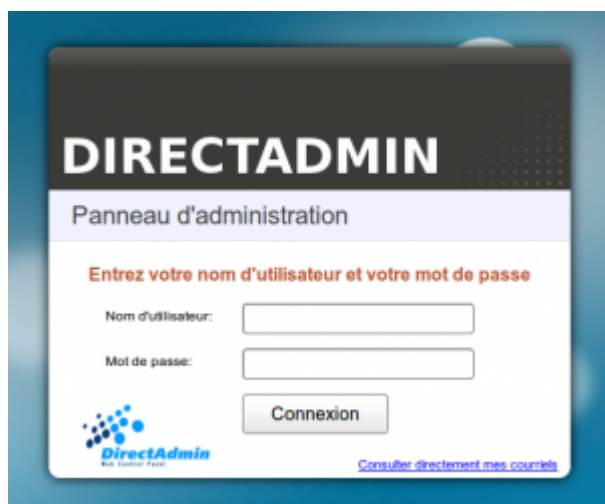
Formulaire de connexion à DirectAdmin