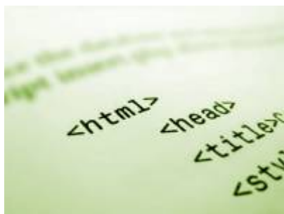
Code source HTML.

Si vous avez un site web en cours de développement, il y a plusieurs éléments à prendre connaissance afin de rendre la démarche plus aisée de part et d'autre. Nous en avons rassemblé quelques-uns dans les pages de cette section.