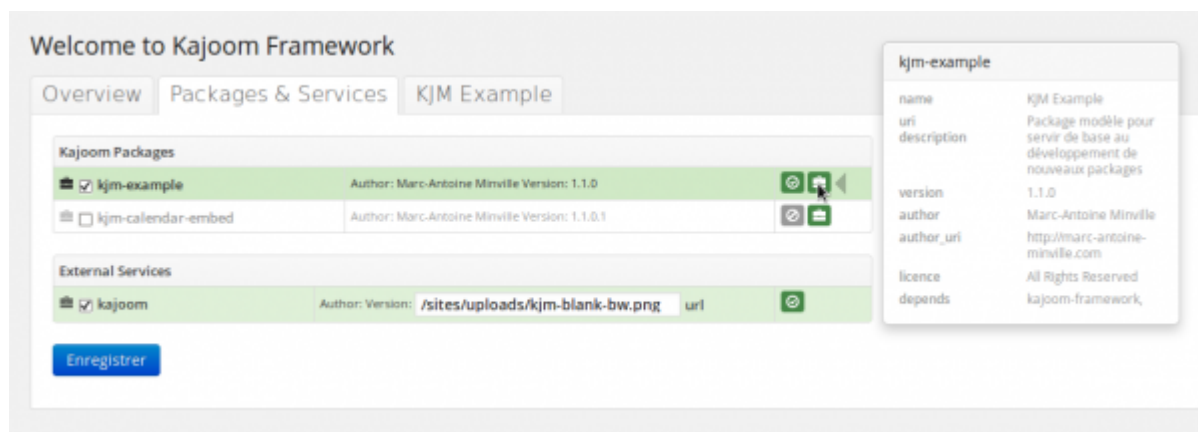
Onglet des Packages et Services du plugin Kajoom Framework.